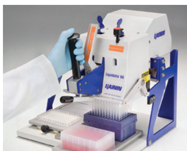
1. Установите наконечники