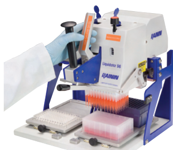
2. Наберите образец