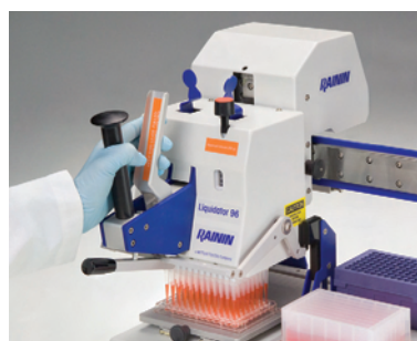
3. Дозируйте образец